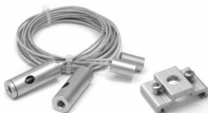
регулируемая система подвеса - цанговый подвес