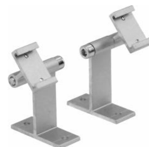
стенное крепление с регулировкой угла установки